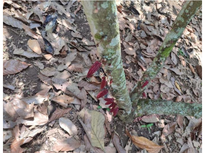
Anexo 4. Índice de fructificación