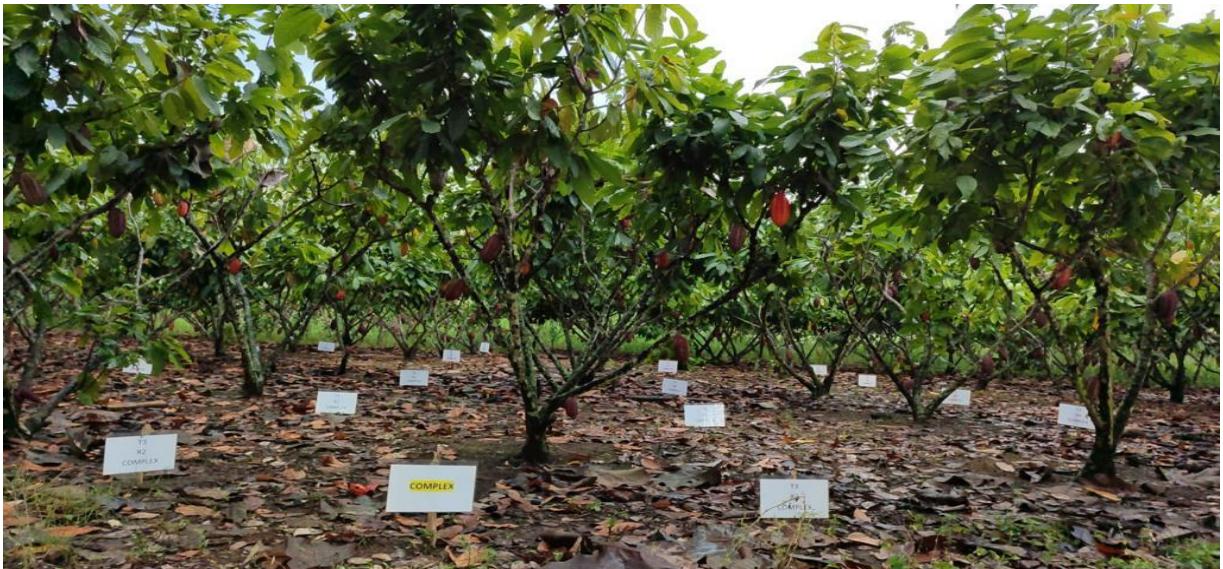
Anexo 2. Establecimiento de los tratamientos a evaluar