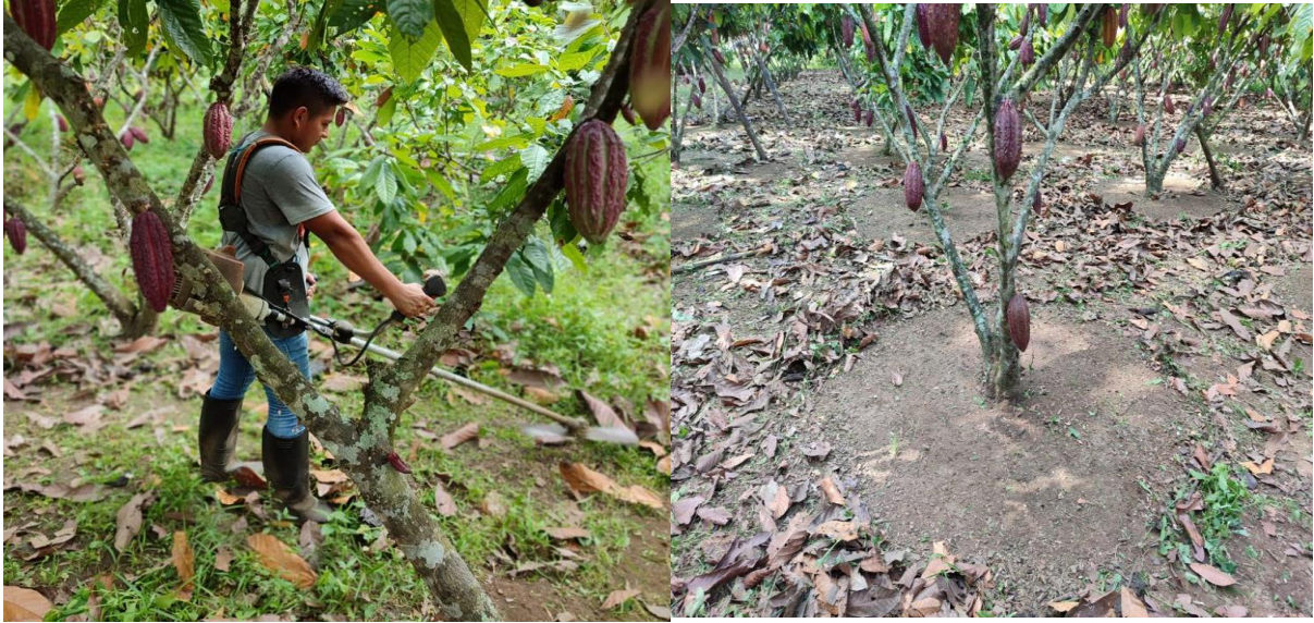
Anexo 1. Limpieza de maleza antes de aplicar los tratamientos