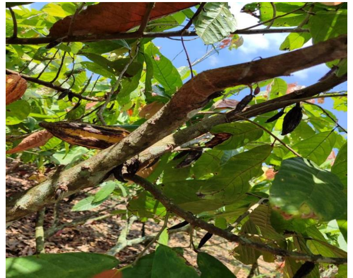
Anexo 6. Índice Cherrelle Wilt