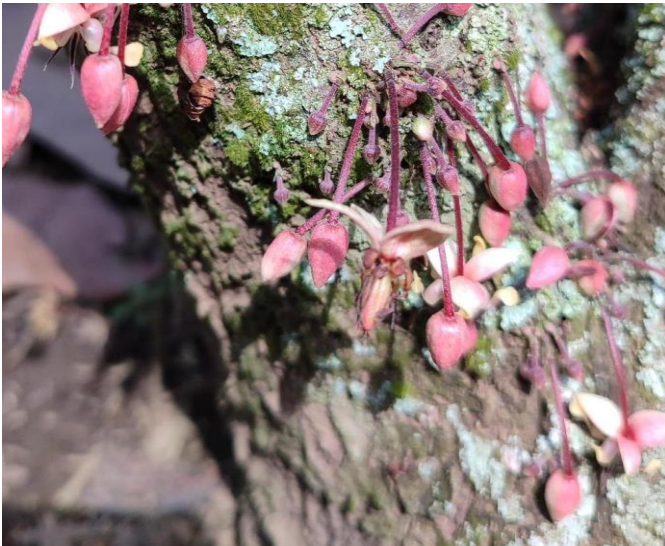
Anexo 5. Índice de Floración