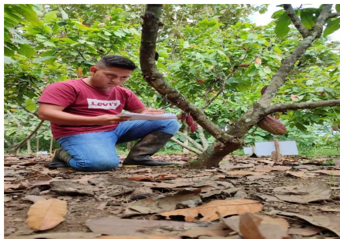
Anexo 7. Toma de datos