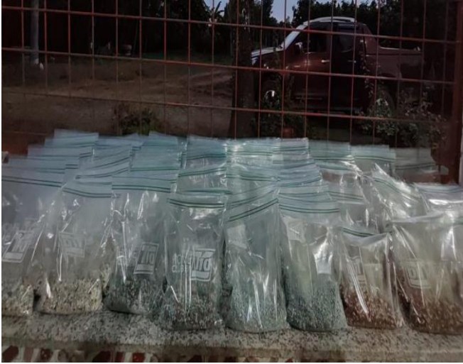
Anexo 3. Dosificación de los tratamientos a evaluar