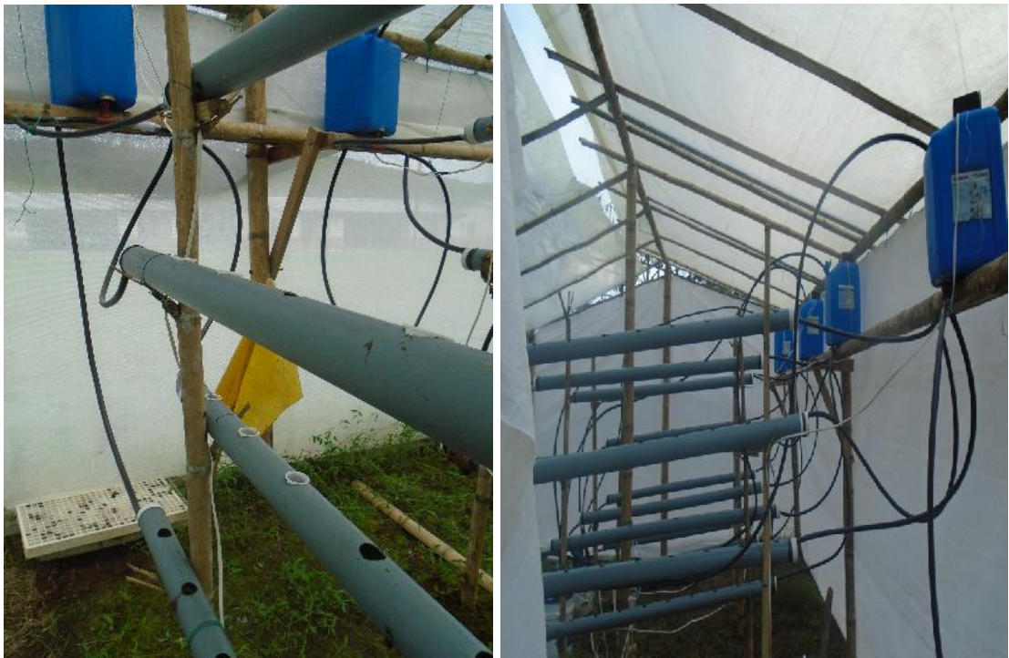
Figura 6. Colocación de las 4 bombas de agua de ½ hp.