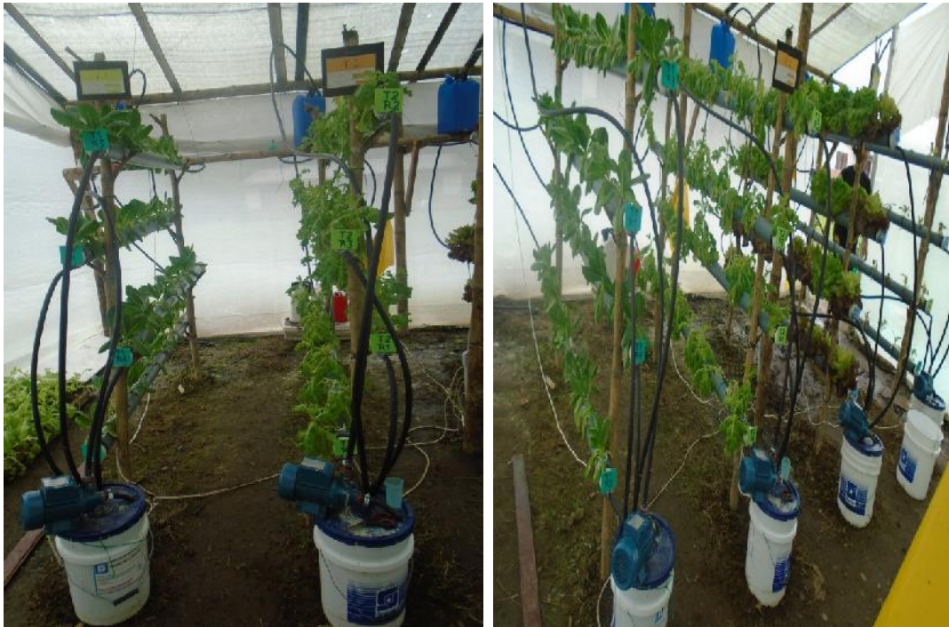
Figura 11. Peso y cosecha de lechuga, en diferentes soluciones nutritivas en sistema hidropónico en el comportamiento de tres variedades de lechuga ( Lactuca sativa ) en Santo Domingo