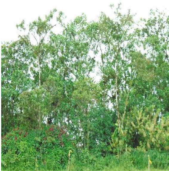
Figura 1. Elección del lugar donde se realizó el trabajo de campo y adecuación del sitio.