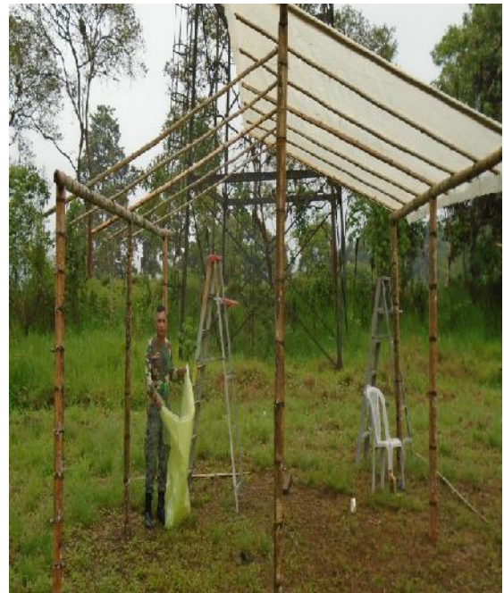
Figura 4. Colocación del sarán