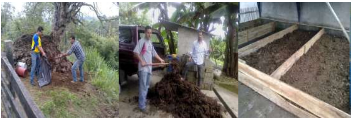
Fotos. Recolección de estiércol y raquis de las cosechas.