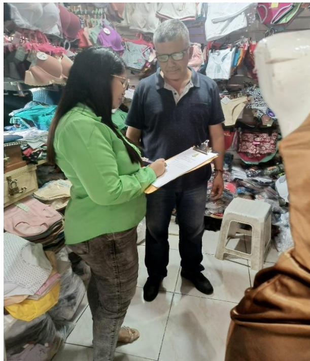
Evaluación a los comerciantes del cantón Quevedo