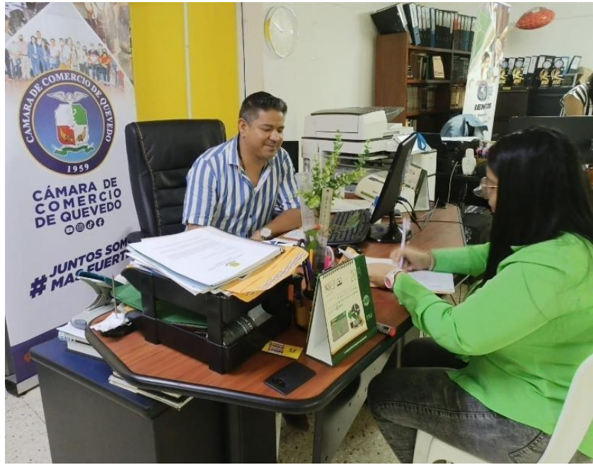
Entrevista con el presidente de la Cámara de Comercio del cantón Quevedo