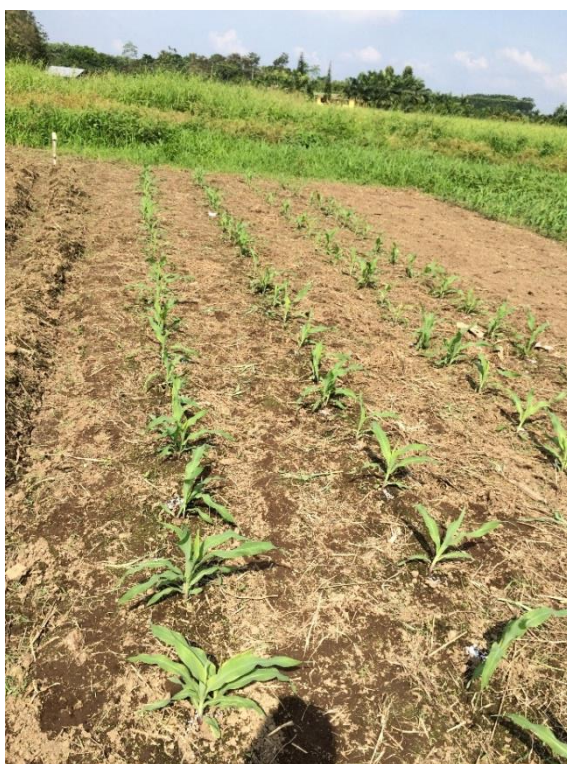
Anexo 18 Cultivo a los 18 días