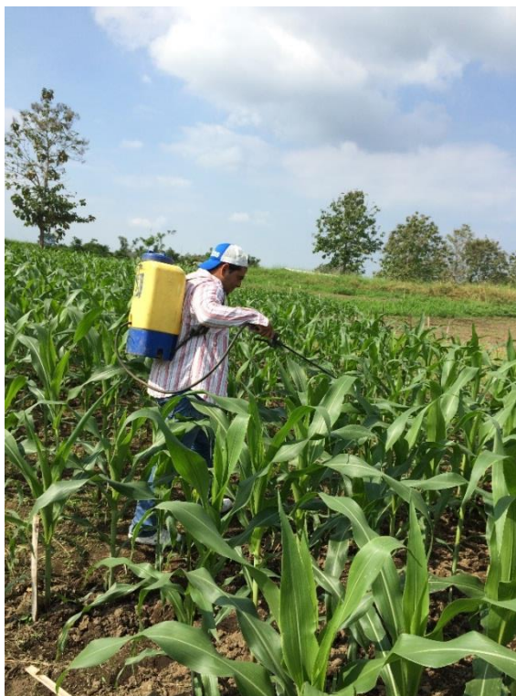
Anexo 21 Segundo control de insectos y fertilización foliar