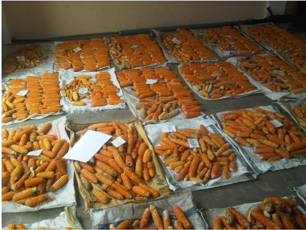
Anexo 23 Identificación del material cosechado