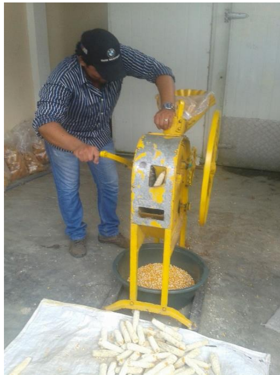
Anexo 24 Desgranado del maíz