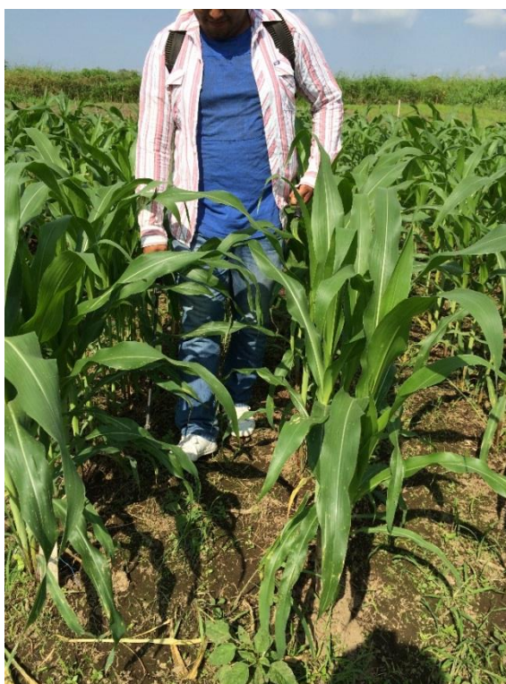
Anexo 20 Control químico de maleza dirigido