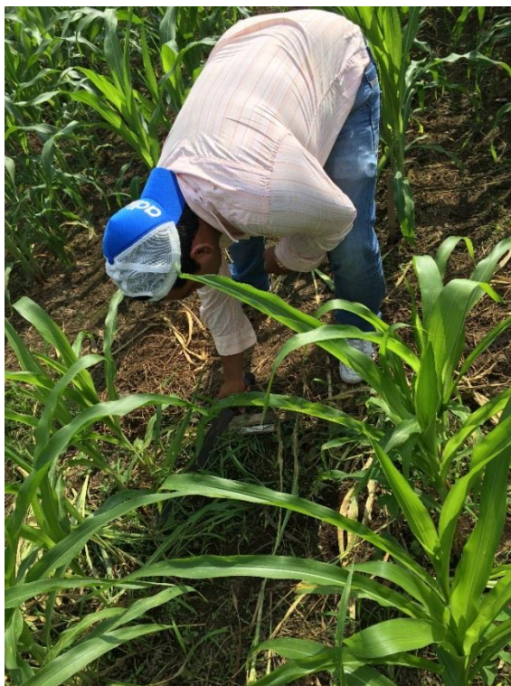
Anexo 19 Segundo control de malezas