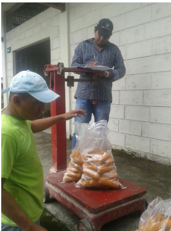
Anexo 22 Pesado del rendimiento por parcela