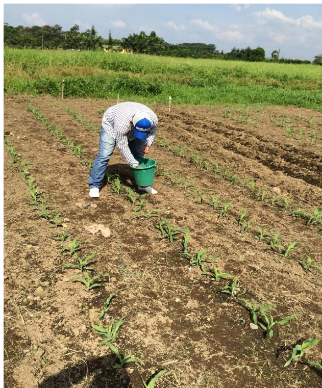
Anexo 16 Primera Fertilización edáfica (15 días)

** : altamente significativo; * : significativo; ns: No Significativo