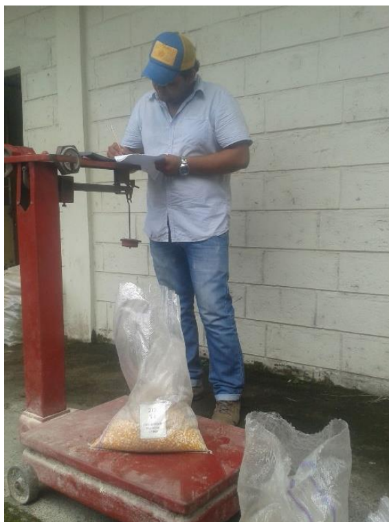
Anexo 25 Peso puro del grano