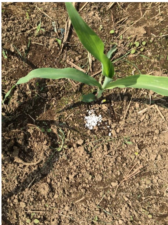
Anexo 17 Raleo del cultivo (15 días)