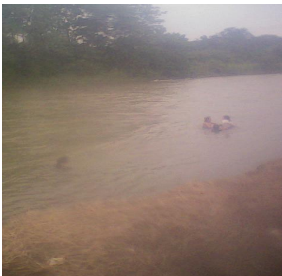
Foto 1 Río y puente de San Pablo