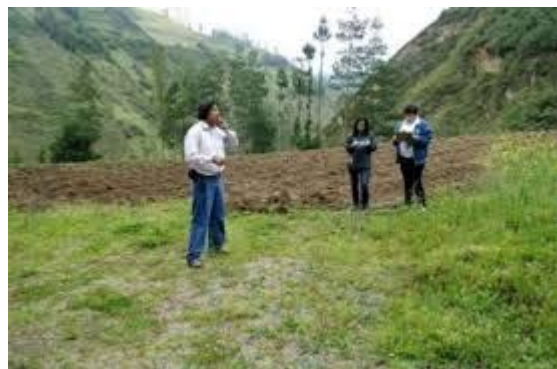
Habitantes del sector San Pablo