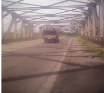
Puente San Pablo