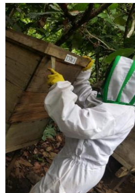
Anexo 22. Revisión de las colmenas.