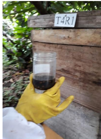
Anexo 26. muestras de abejas para cálculo de porcentaje del acaro varroa destructor.