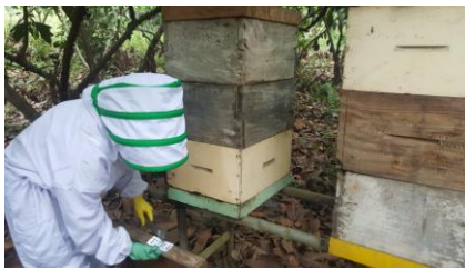
Anexo 18. Identificación de los tratamientos.