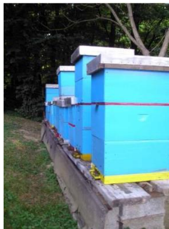
Figura 1: Colmena tipo Langstroth (18).

Conjunto formado por un enjambre, la estructura que lo contiene y los elementos propios necesarios para su supervivencia. Puede ser de dos tipos: rústica: es la que tiene sus panales fijos e inseparables del recipiente. Móvil o moderna: es la que posee estructuras independientes que facilitan el manejo del apicultor al interior de la colmena (16).