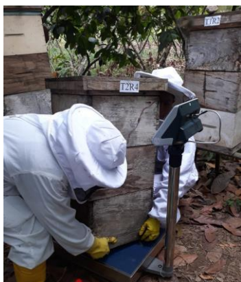
Anexo 19. Pesaje de las colmenas.