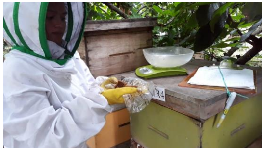
Anexo 24. Pesaje del residuo de las tortas.