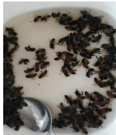
Anexo 27. Identificación del acaro varroa.