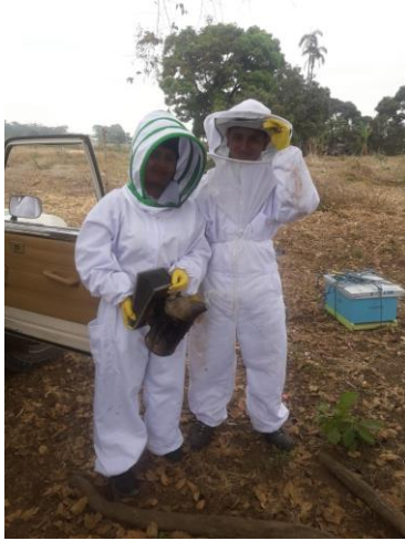
Anexo 17. Materiales y Equipo de protección.