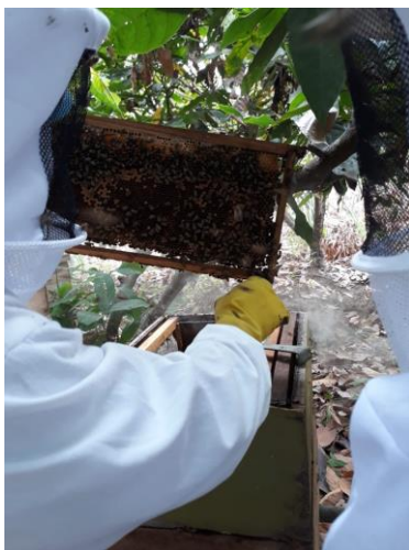
Anexo 25. Muestra para determinar la incidencia de varroa