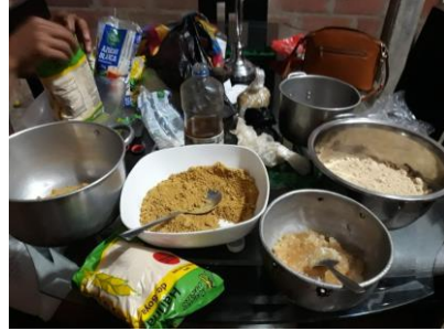
Anexo 20. Preparación de las tortas proteicas.