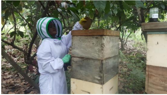
Anexo 23. aplicación de las tortas proteicas.