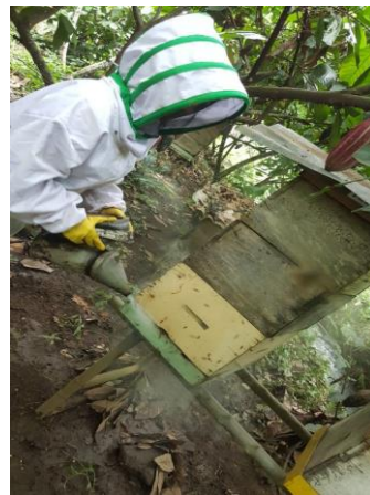
Anexo 21. Aplicación de humo a las colmenas para lograr control sobre las abejas.