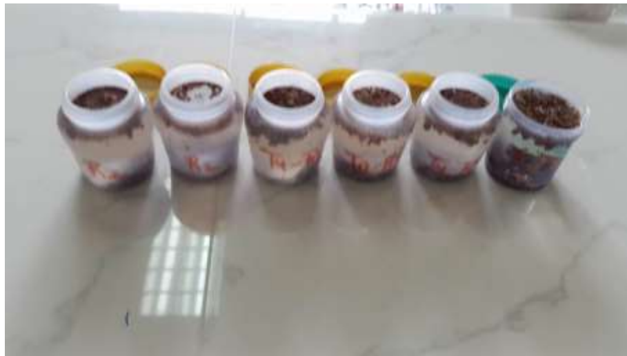
Figura 4. A.B. Toma de parámetros físicos (Temperatura). C. Selección de muestras para toma de pH de la almendra.