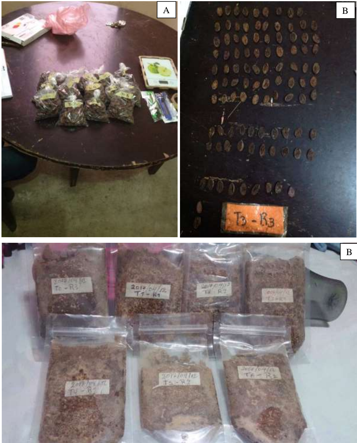
Figura 5. A. Selección de muestras y prueba de corte. B. Corte de los granos fermentados de cacao. C. Pasta de cacao elaborada para prueba sensorial.