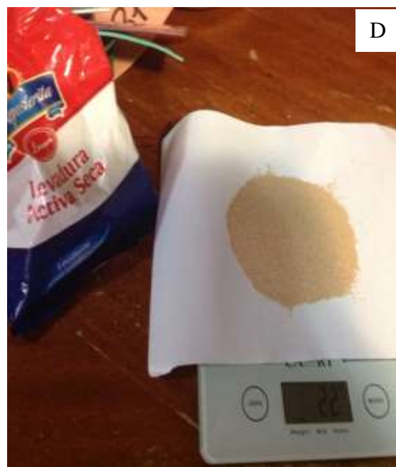
Figura 2. Pesado de frutas: A. Aguacate. B. Manzana. C. Banano. D. Peso de levadura