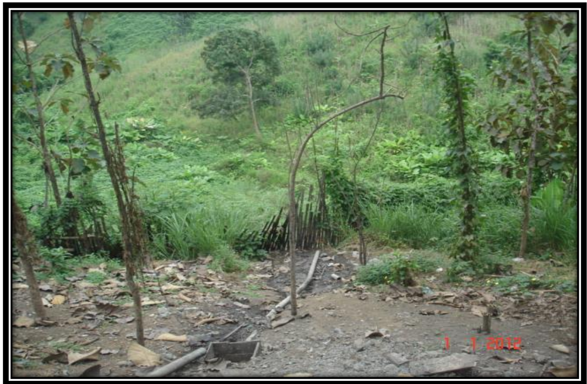
Figura. 20 Daños que causa la miel de cacao en el medio ambiente