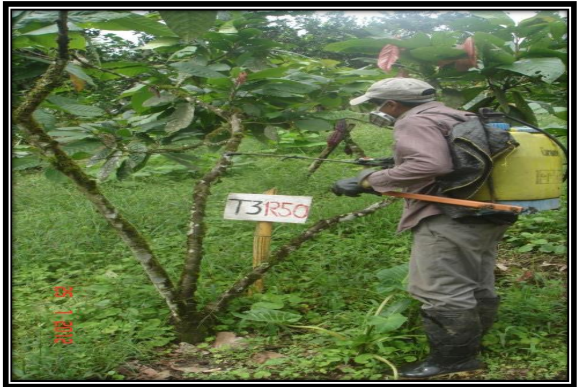
Figura 13. Aplicación de la baba de cacao fermentada a las plantas de cacao Infestadas por los musgos ( Rigodiumimplexum )