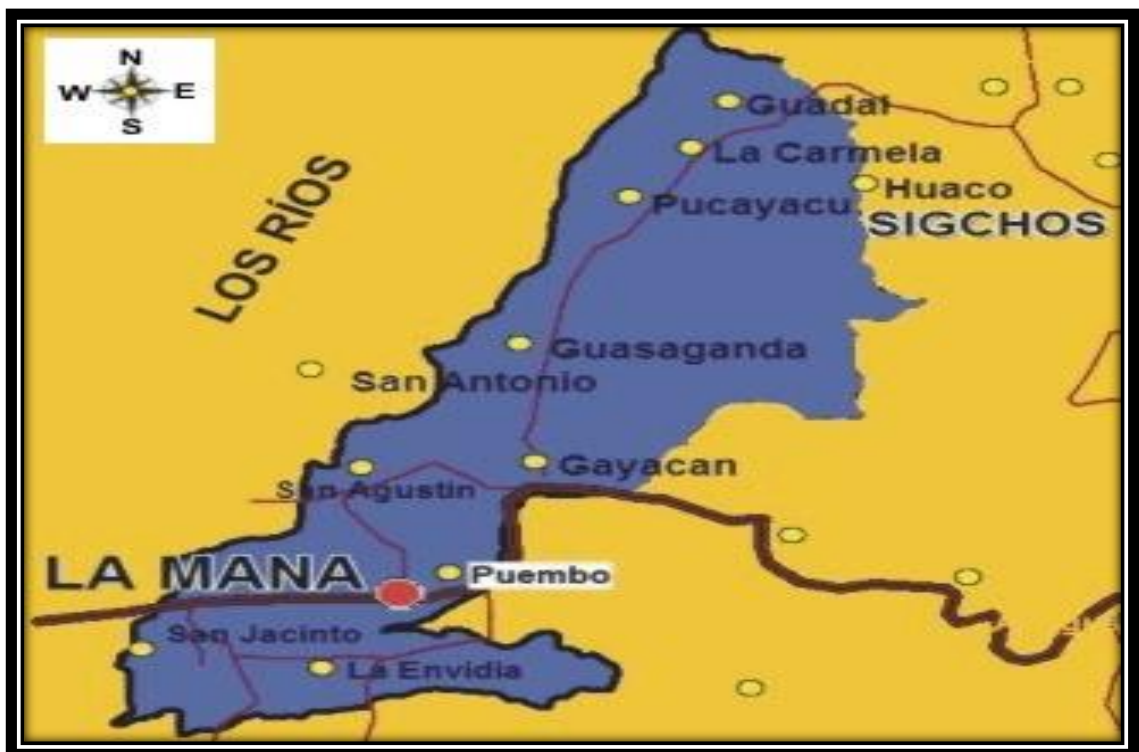
Figura 22. Ubicación del área experimental