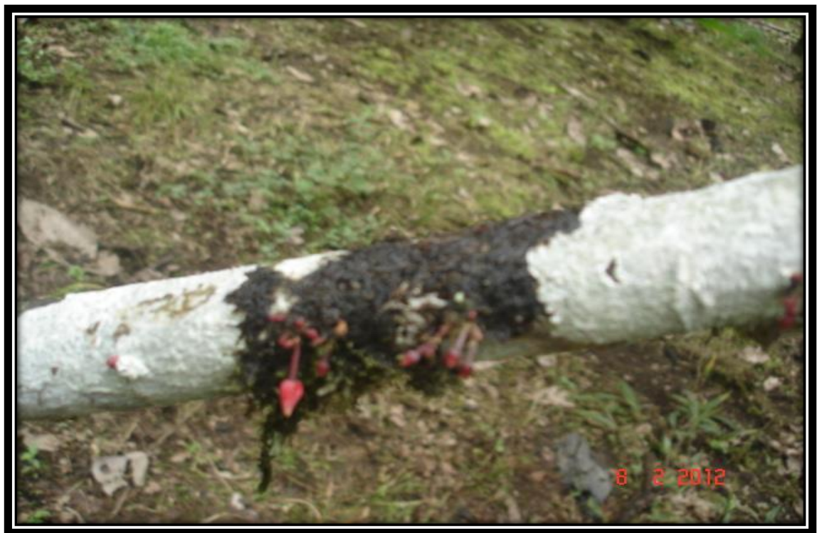
Figura16. Plantas infestadas de líquenes resultan de la unión entre un hongo ( ascomicetes y basidiomicetes )