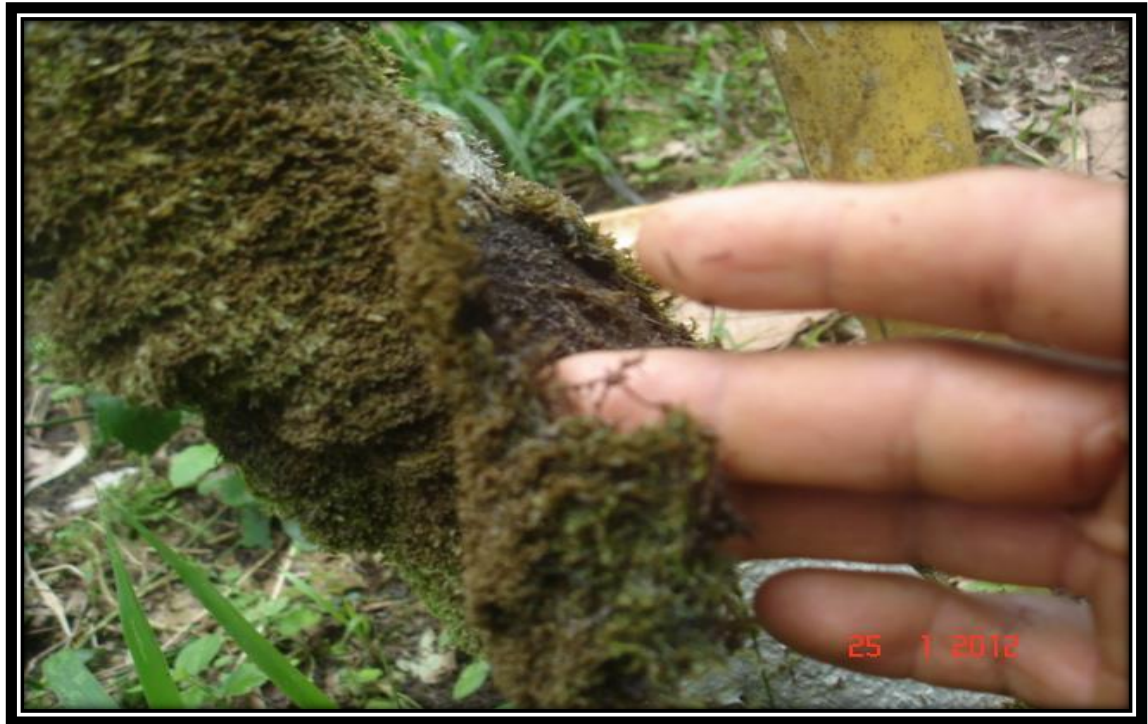
Figura15. Demostrando como los musgos cubren los cojines florales e impiden la emisión de flores donde se esconden los chinches