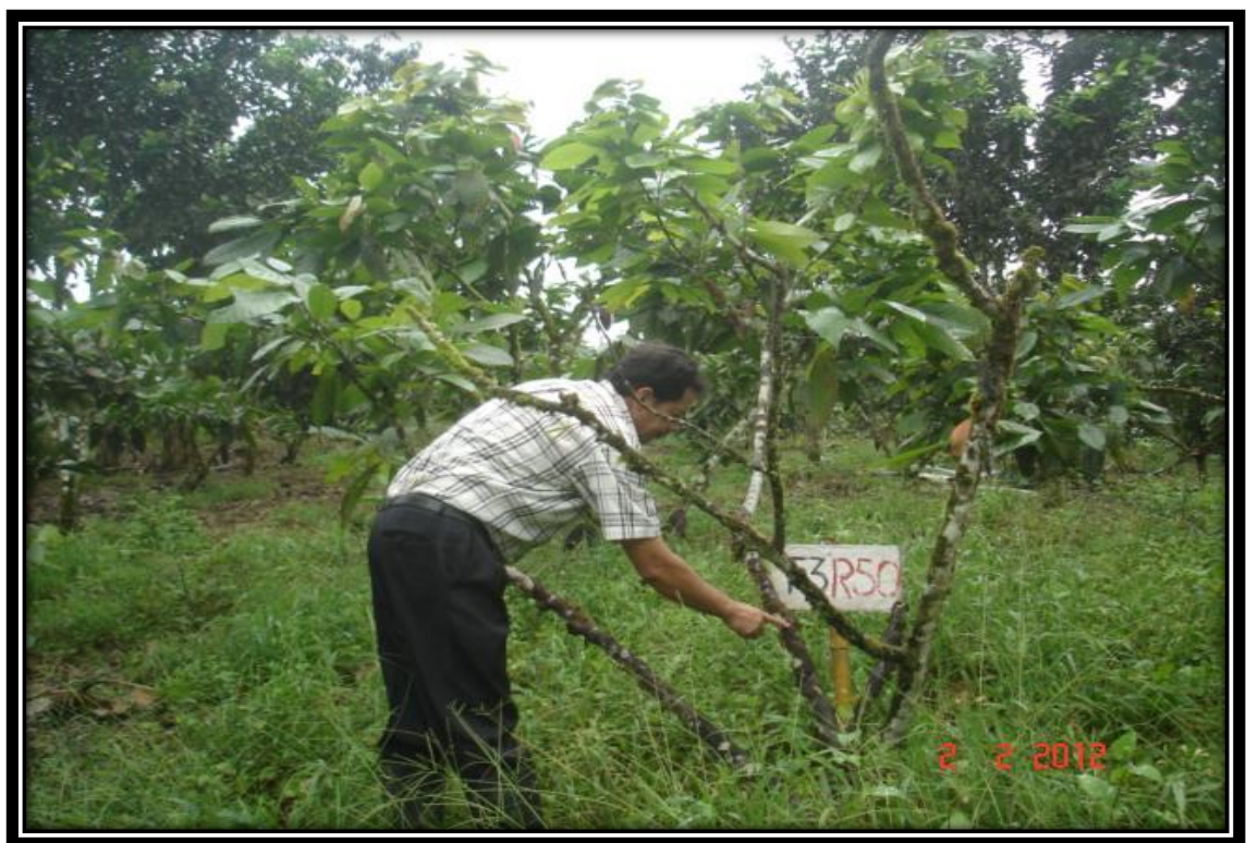
Figura14. Visita al área experimental del control de musgos y chinches