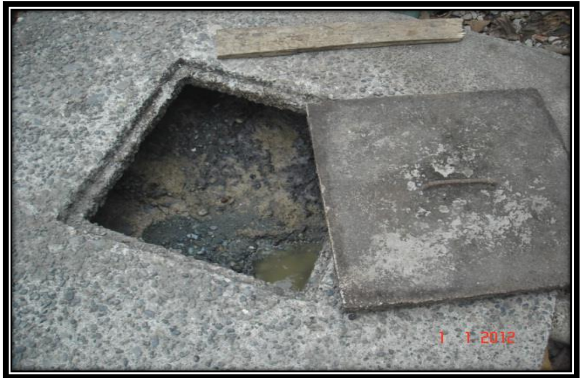
Figura 11. Depósito para la recolección de la baba de cacao