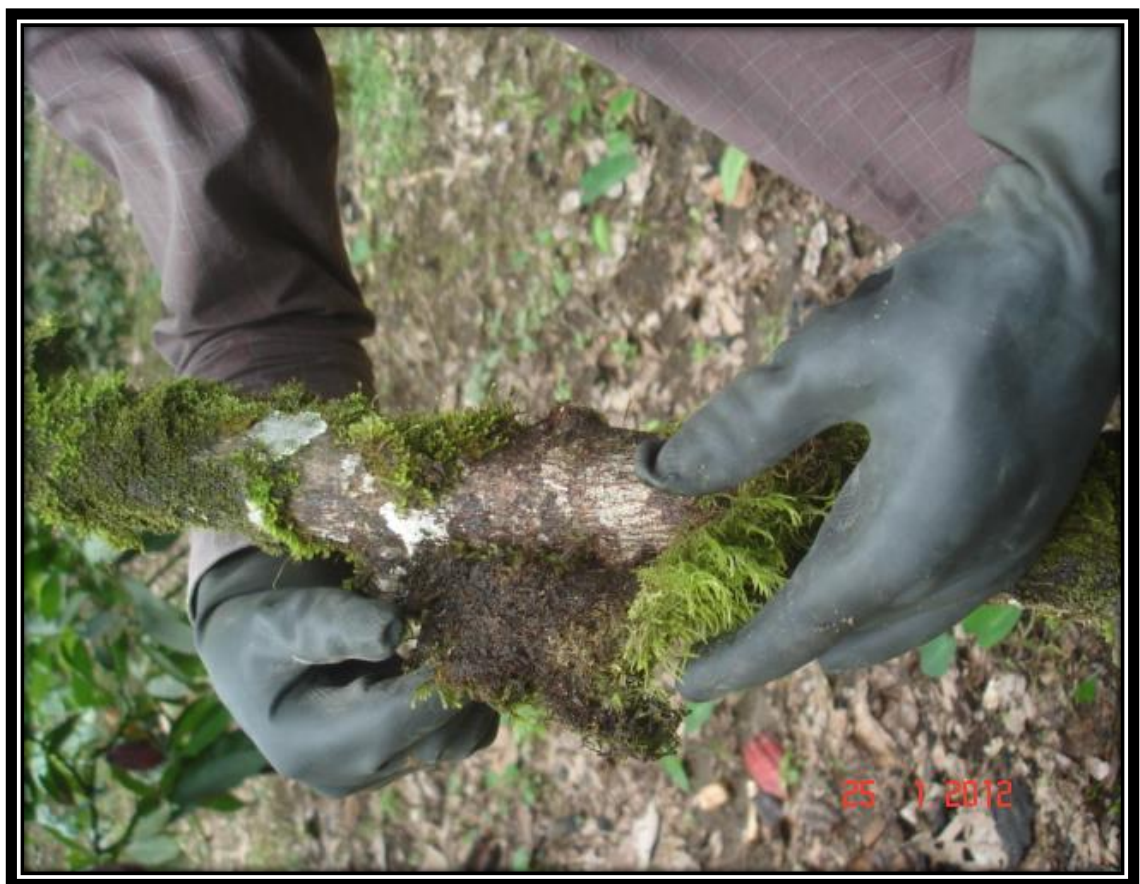
Figura 12. Musgos como hospederos de chinches en el cultivo de cacao CCN51