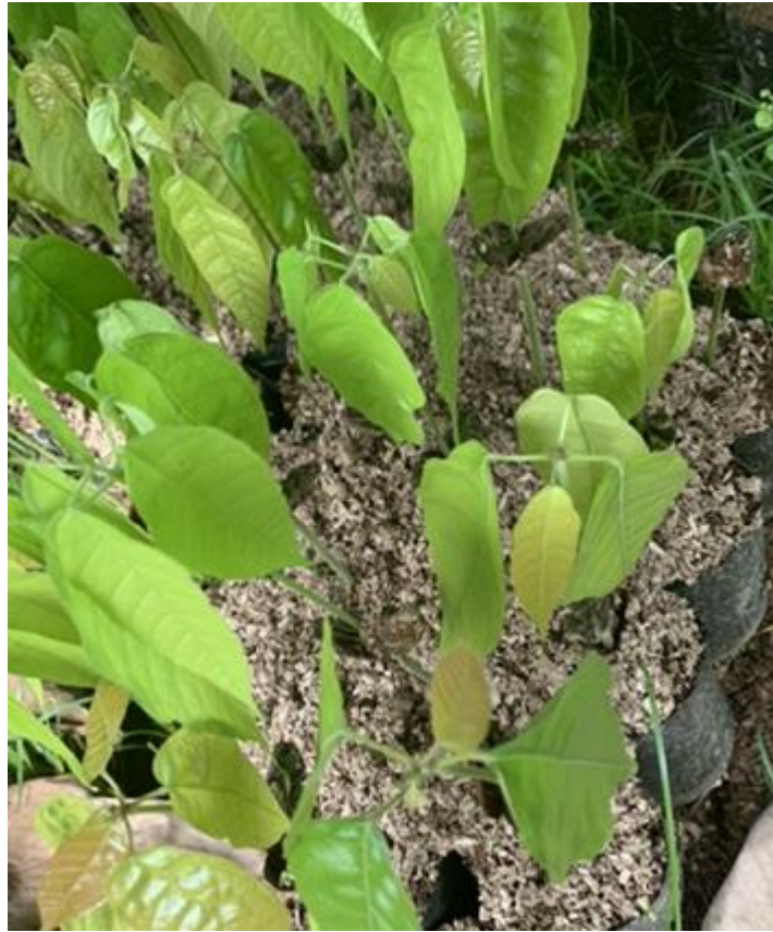
Anexo 17. Plántulas de cacao a los 20 días