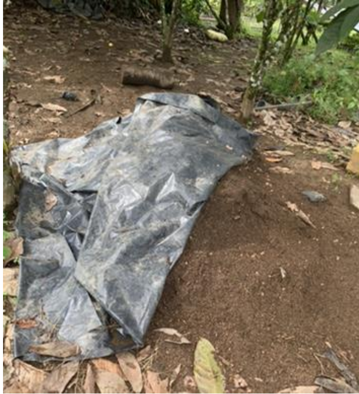
Anexo 13. Sustrato utilizado en el ensayo