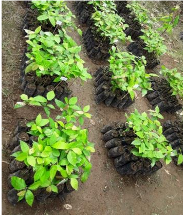
Anexo 19. Distribución de las plántulas en el ensayo