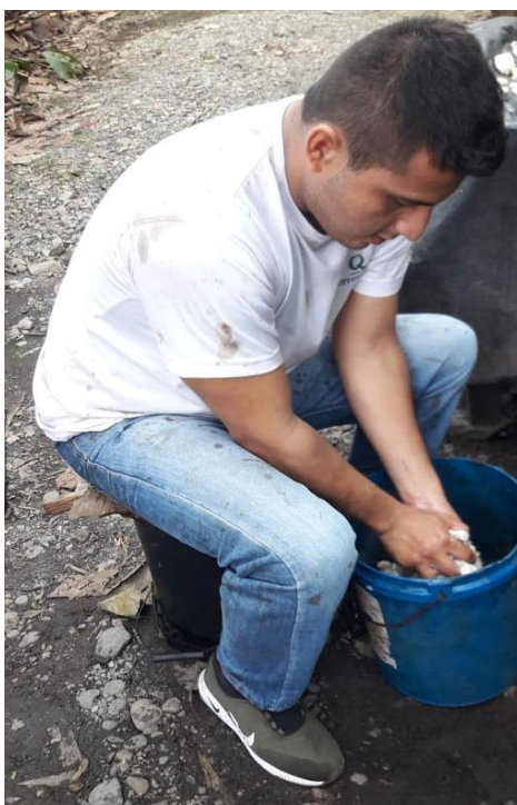
Anexo 15. Extracción de las semillas para la siembra