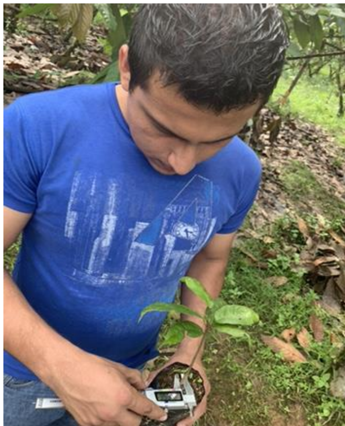
Anexo 18. Primera evaluación del diámetro del tallo