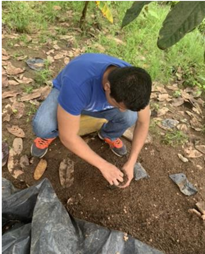
Anexo 14. Llenado de fundas