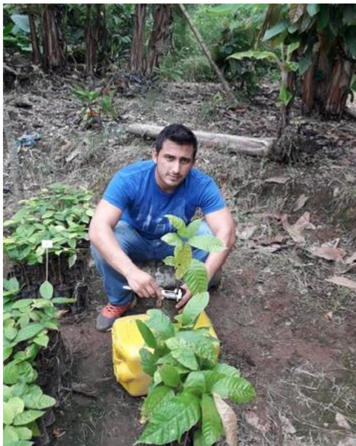
Anexo 22. Segunda evaluación del diámetro del tallo