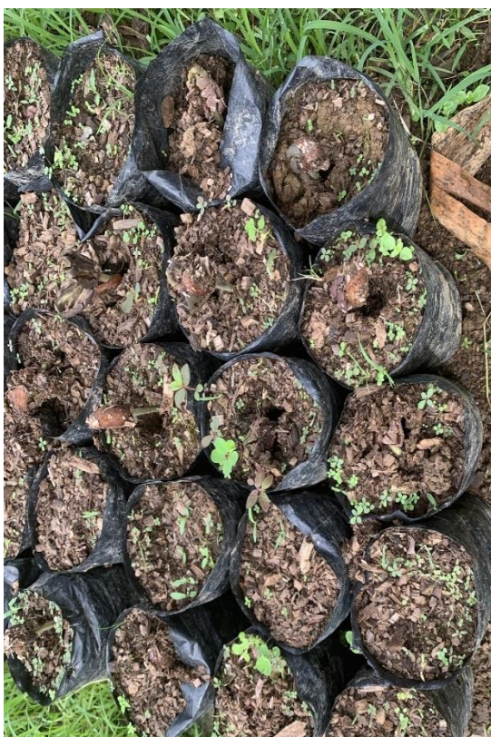
Anexo 16. Emergencia de plántulas