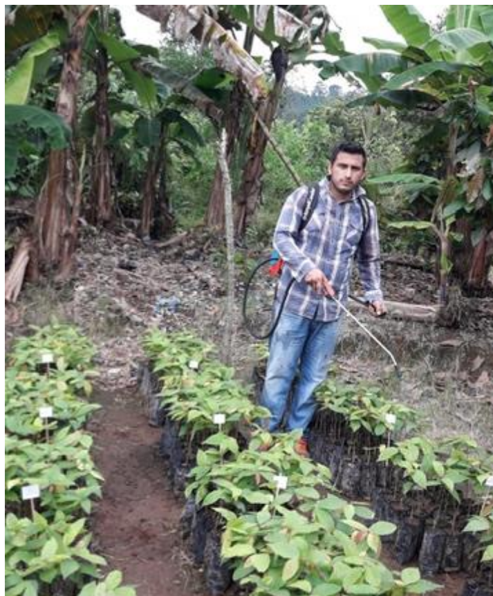
Anexo 20. Aplicación de los productos en estudio