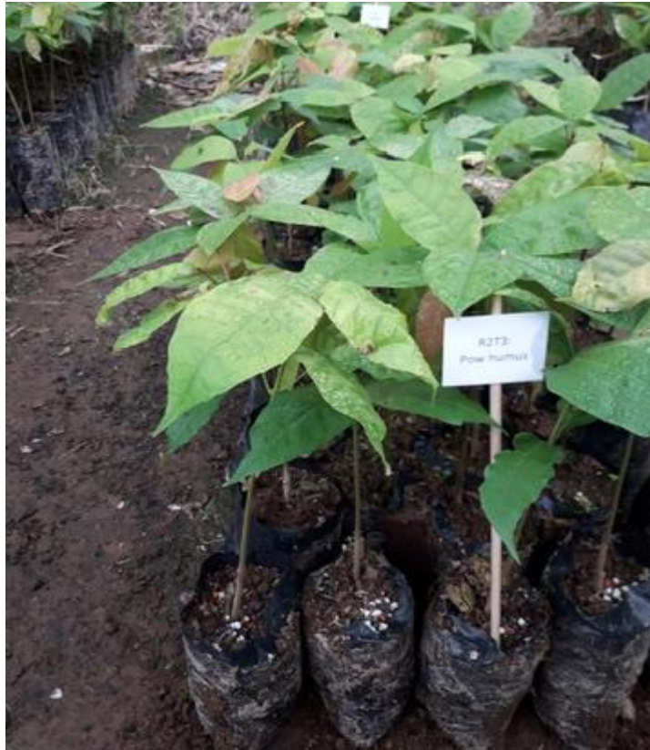
Anexo 21. Aplicación de fertilizante edáfico