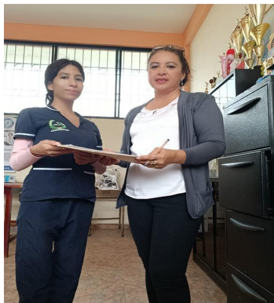
Ilustración 10. Entrega de estrategias para el colegio