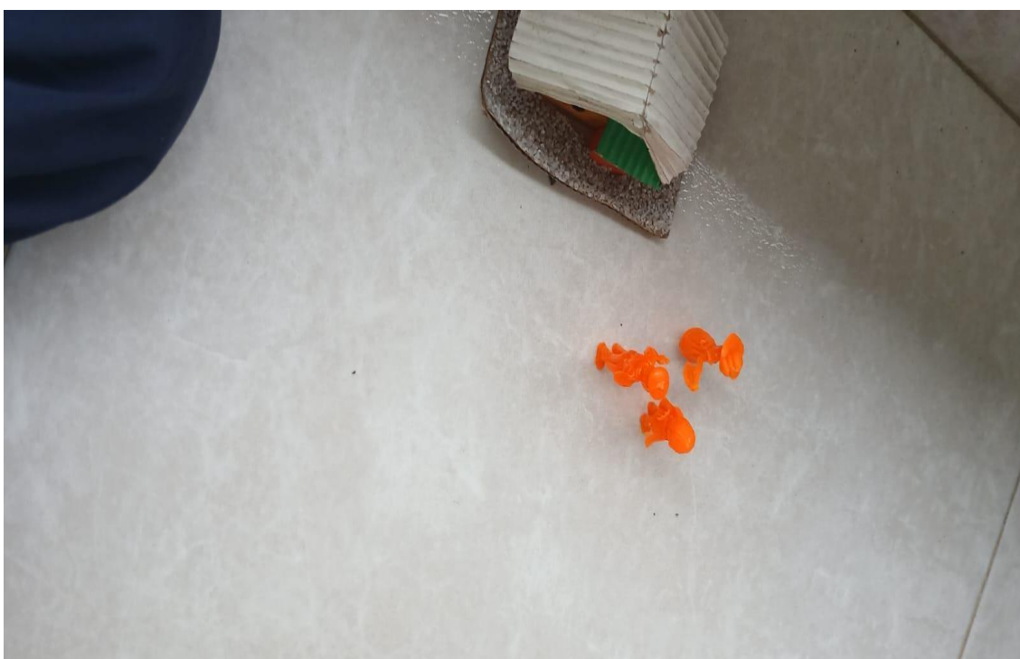
Ilustración 9. Hijo hacia los padres