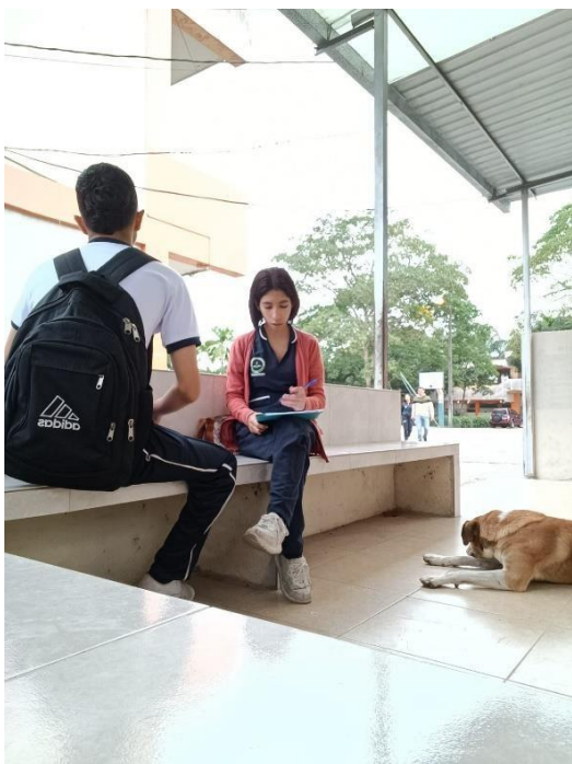
Ilustración 7. Entrevista con estudiante