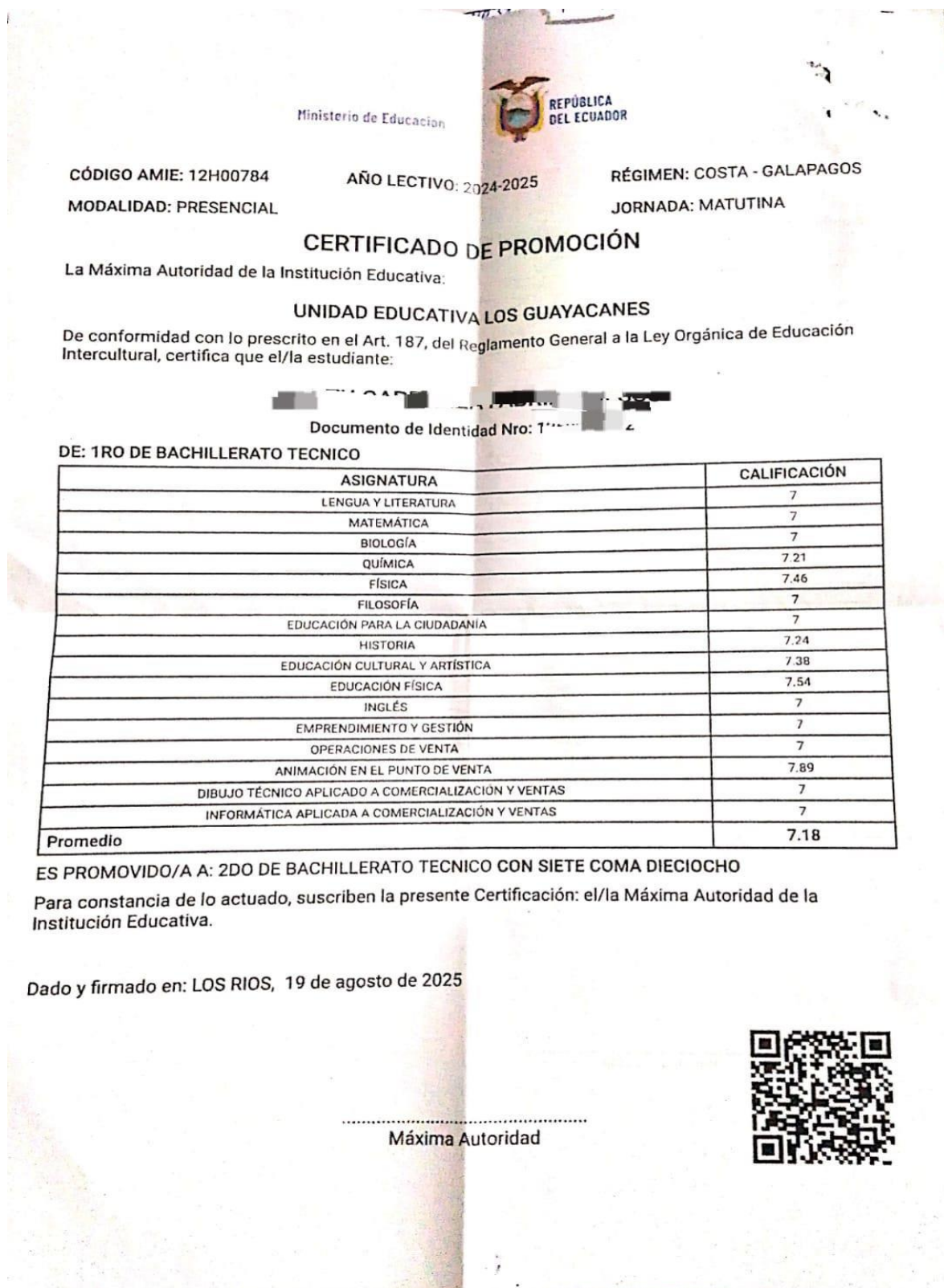
Ilustración 3. Calificaciones del periodo lectivo 2024-2025