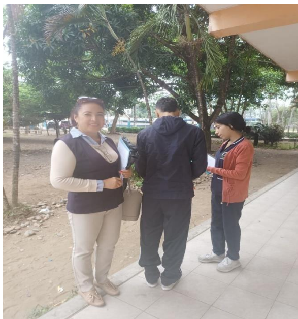
Ilustración 5. Entrega de acta de consentimiento