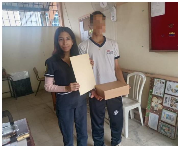
Ilustración 11. Entrega de estrategias para trabajar en casa