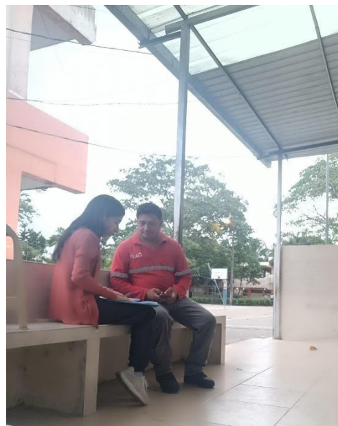
Ilustración 4. Entrevista padre de familia