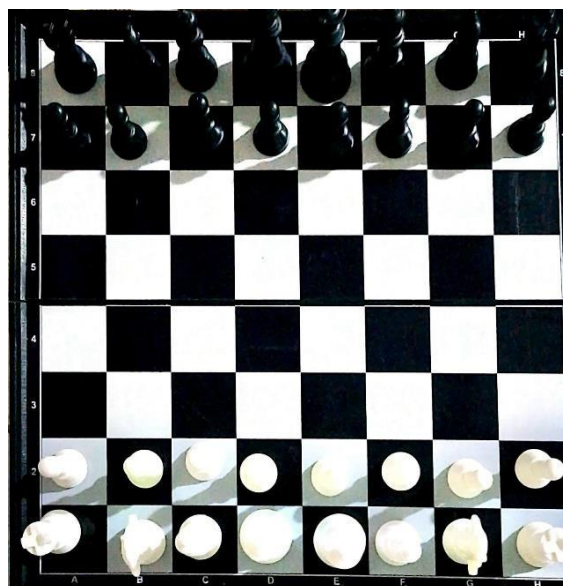
Ilustración 6. Juego de ajedrez