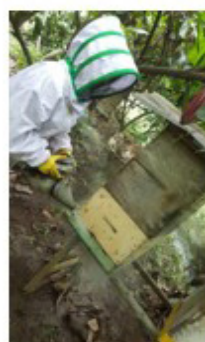
Anexo 21. Aplicación de humo a las colmenas para lograr control sobre las abejas.