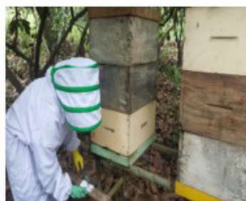
Anexo 18. Identificación de los tratamientos.