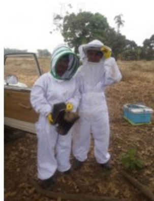
Anexo 17. Materiales y Equipo de protección.