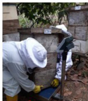
Anexo 19. Pesaje de las colmenas.