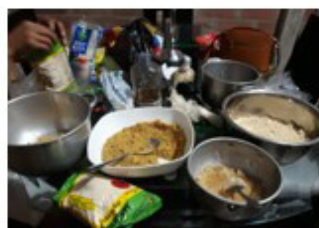
Anexo 20. Preparación de las tortas proteicas.