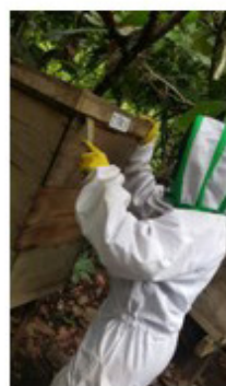
Anexo 22. Revisión de las colmenas.