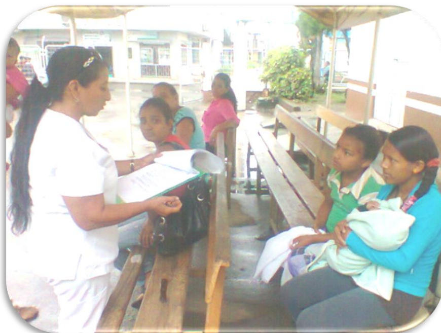
Fuente: Encuestas realizadas en Hospital Jaime Roldós Aguilera, 2015. Elaborado: Nancy Guamán Loor