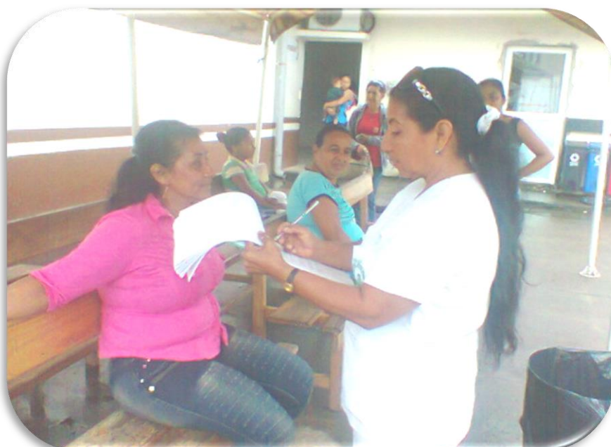
Fuente: Encuestas realizadas en Hospital Jaime Roldós Aguilera, 2015. Elaborado: Nancy Guamán Loor