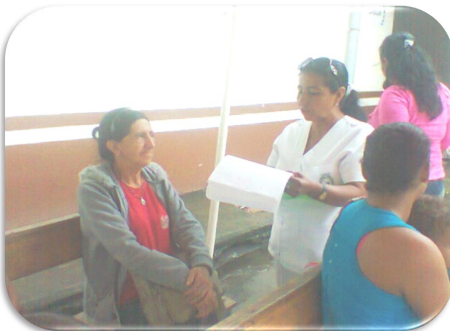
Fuente: Encuestas realizadas en Hospital Jaime Roldós Aguilera, 2015. Elaborado: Nancy Guamán Loor