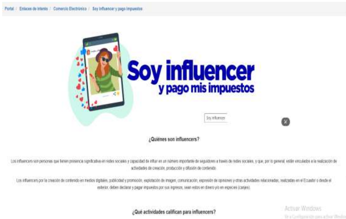
Ilustración 4. Sitio web Servicio de rentas internas

Nota: (Servicios de Rentas Internas , s.f.)