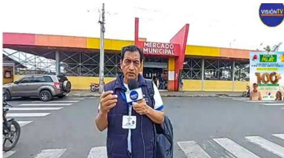
Ilustración 6. Carteles en mercados y centros comerciales

✚ Tradicionales. Carteles en mercados y centros comerciales.