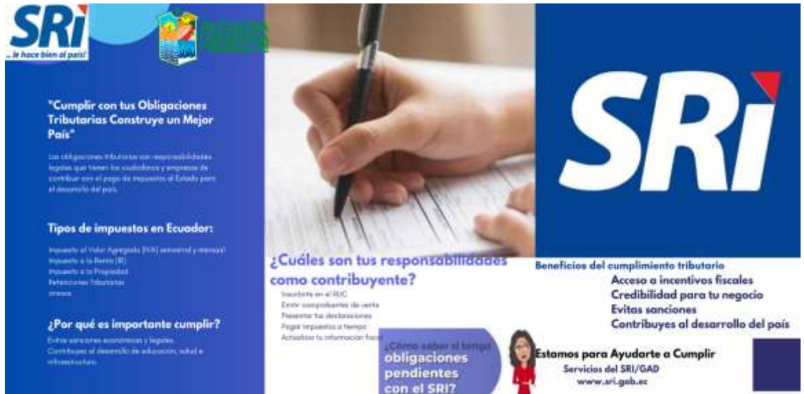
Ilustración 7. Folletos, talleres, ferias educativas.

✚ Interacción directa. Folletos, talleres, ferias educativas.