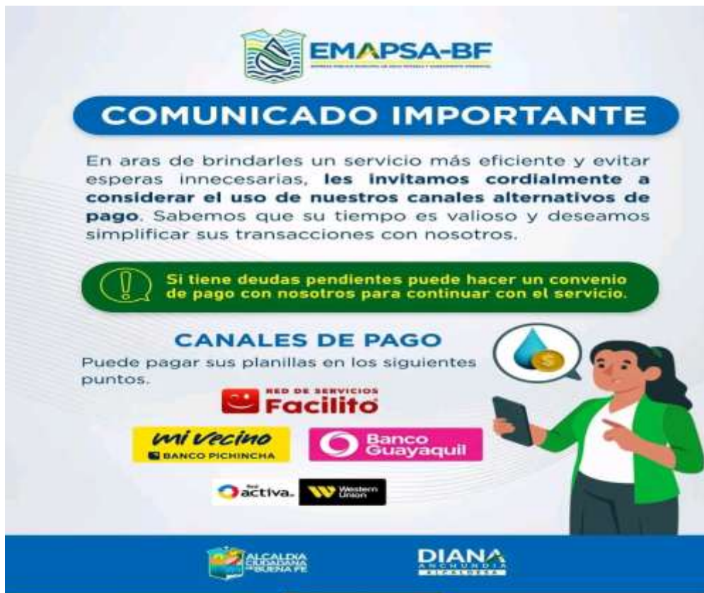
Ilustración 5. Sitio web GAD municipal del Cantón Buena Fe.