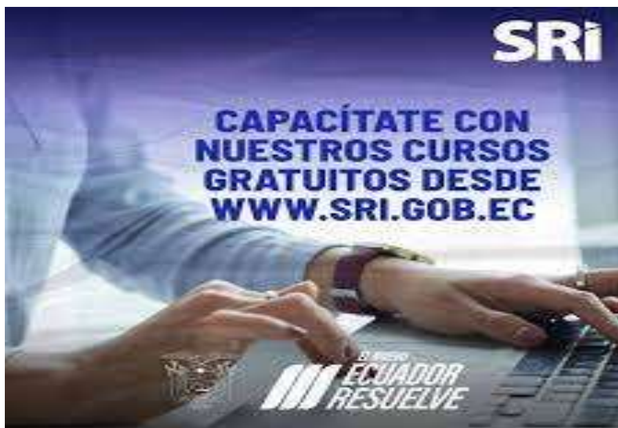
Ilustración 2. Sitio web Servicio de Rentas Internas

Nota: Sitio web Servicio de Rentas Internas