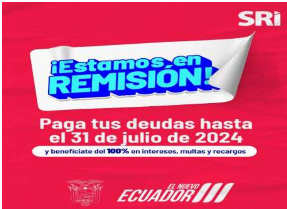
Ilustración 3. Sitio web Servicio de rentas internas

Nota: Sitio web Servicio de Rentas Internas